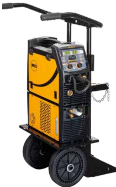
MicroMag 225 + CU121 + Trolley 03