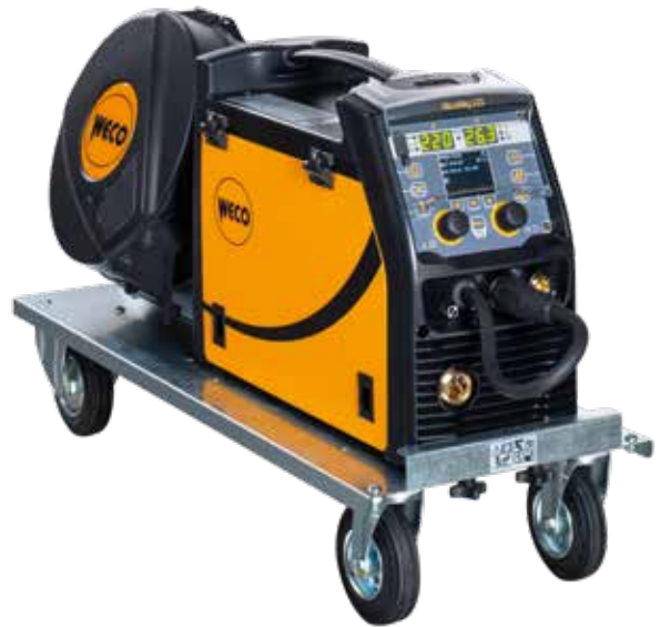
MicroMag 225 + Trolley H