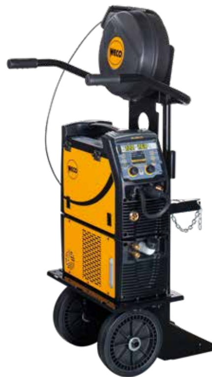
MicroMag 225 + CU121 + Trolley 03 + Kit D300