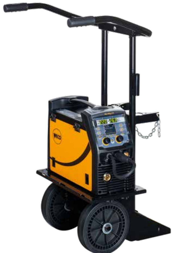
MicroMag 225 + Trolley 03