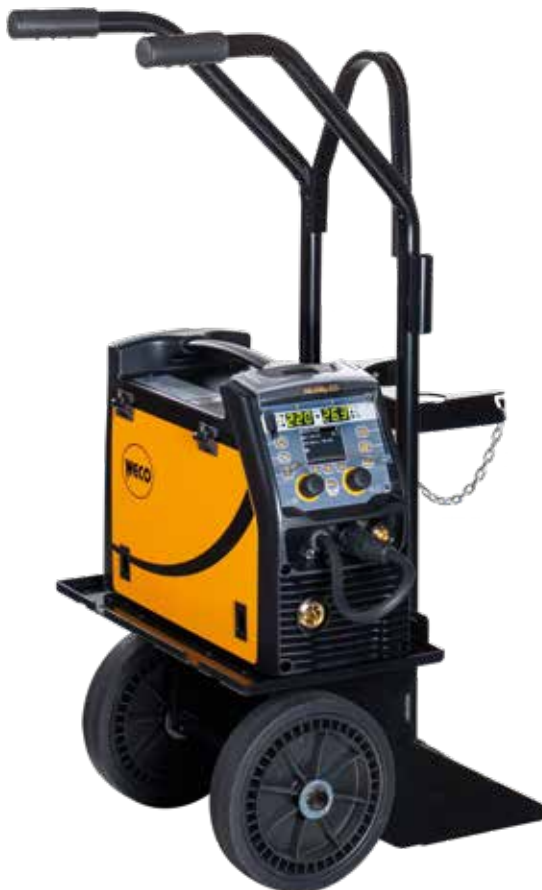
MicroMag 225 + Trolley 02