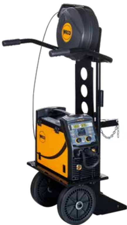
MicroMag 225 + Trolley 03 + Kit D300