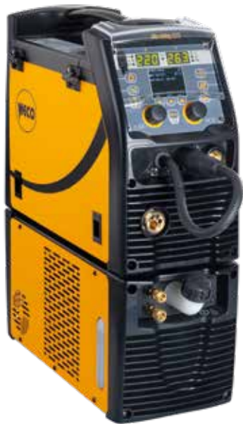
MicroMag 225 + CU121